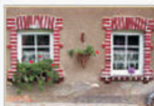
Agro Izerski Potok Przecznica