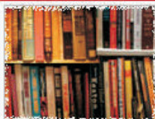
Sudecka Księgarnia Wysyłkowa NaszeSudety.pl